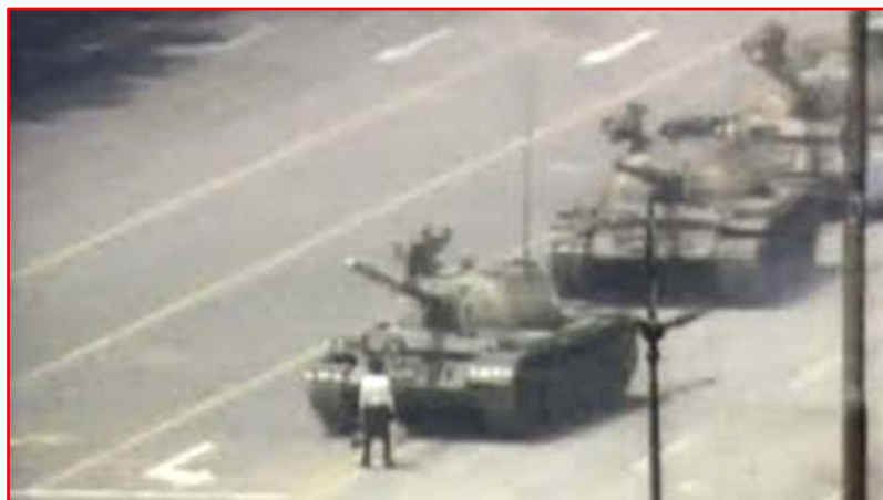
Figure 4 : En 1989, sur la place Tian'anmen à Pékin.

Se placer fermement, avec courage, désarmé face à un agresseur ( Fig. 4 ) s'appelle de la NON-violence. L'homme belligère sera alors les bras ballants, sa colère fera place à la stupeur et la stupeur à la réflexion (Toulat, 1983).