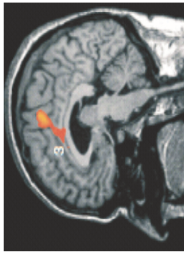
Douleurs neuropathiques au toucher (Quintal et al., 2013)